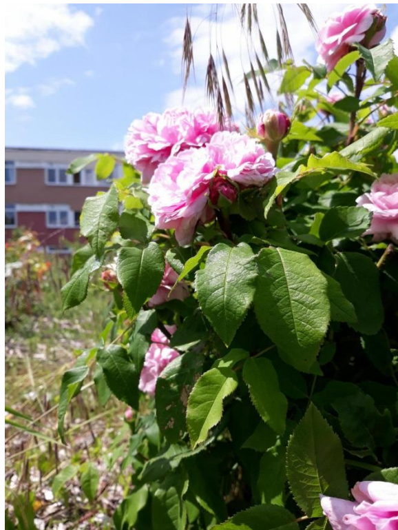
N°3 : Dorian MONDET Photo N° 10 ( classe de 3ème )