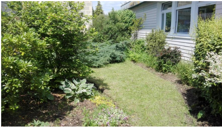
N° 7 : Alexis TONNELIER Photo N° 2 ( classe de 3ème )