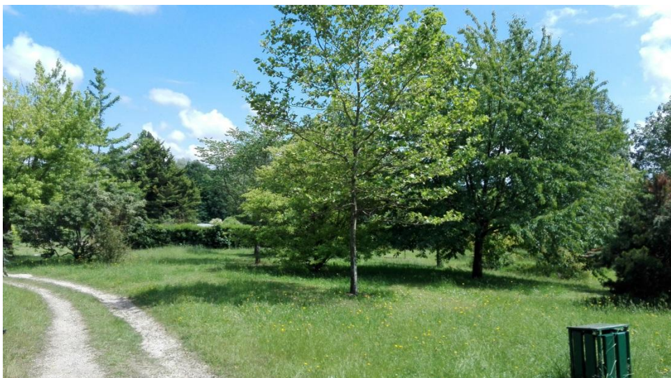
N° 6 : Yoann SCHMITT Photo N° 1 ( classe de 3ème )