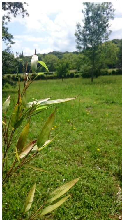
N° 5 : Rémi CARIOT Photo N° 6 ( classe de 4ème )