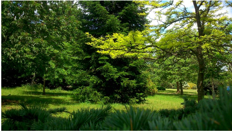
N°1 : Gillian GAUDIN Photo N° 7 ( classe de 3ème )