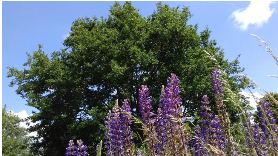
N°2 : Aliénor GACEM Photo N° 5 ( classe de 3ème )