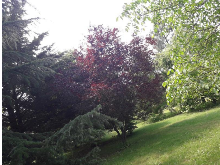
N° 8 : Morgan CAMUS Photo N° 8 ( classe de 3ème )