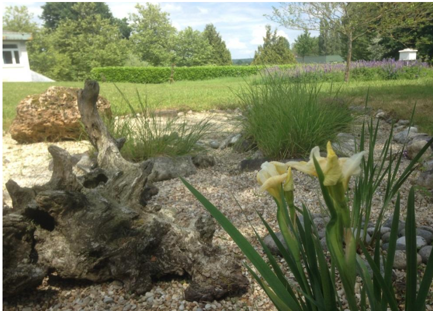
N° 4 : Nathan ROSNET Photo N° 4 ( classe de 3ème )