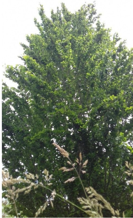
N° 10 : Steevy REINO Photo N° 3 ( classe de 4ème )